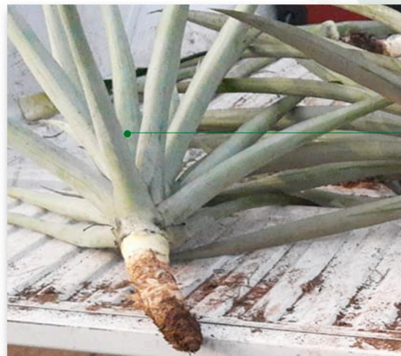
Testigo con fertilizante

Resultados de la Efectividad Biológica en regeneración de raíces en cultivo de piña var. Cayena con productos Green-top, Kelatop Multimetal, Proroot y Biomatter NPK.