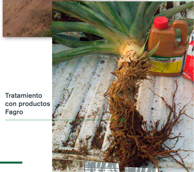
Tratamiento con productos Fagro