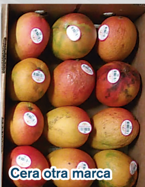
Cera otra marca